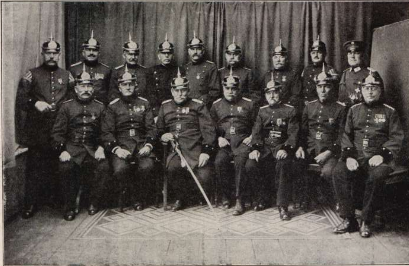
Der derzeitige Verwaltungsrat