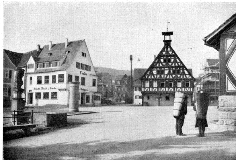
Abb. 90. Blick über den „Plan“ in Ahlbach

Mitten im Dorfe steht die Kirche. An ihrer Stelle stand seit 1467 eine Marien- und Georgskapelle, welche 1755 zu der heutigen Kirche um-