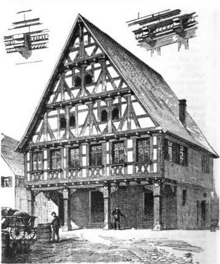
Rathaus im Uhlbach.

weiter unten wurde 1878 gebaut. Die meisten älteren Häuser stehen mit der Giebelseite nach der Straße.