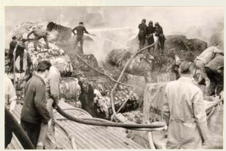
Brand beim Nachbarn ROHTEX 15.5.1956